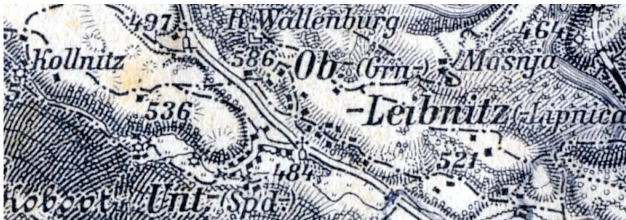
Kolnica, Pusti grad, Zg. in Sp. Lipnica, 1912