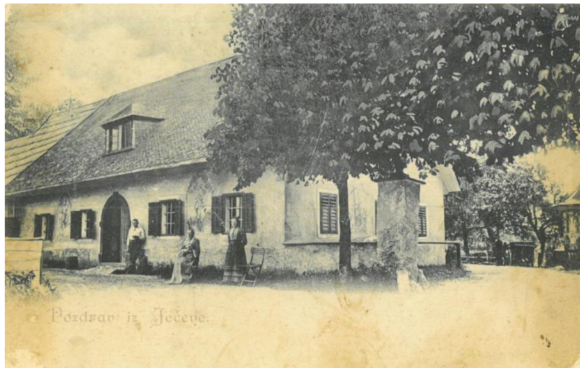
Ječeva, ok. 1900