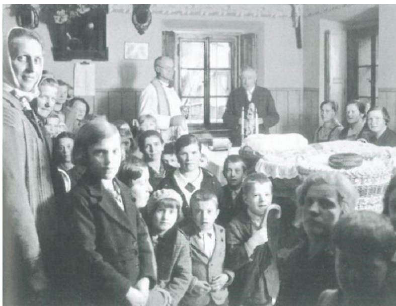
Žegen pri Alenč, 1937