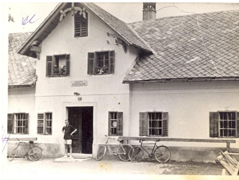
Pri Alenču / Sp. Lipnica

Štiherl Lenart. Kajžar. Poroka z Prešeren Uršula.