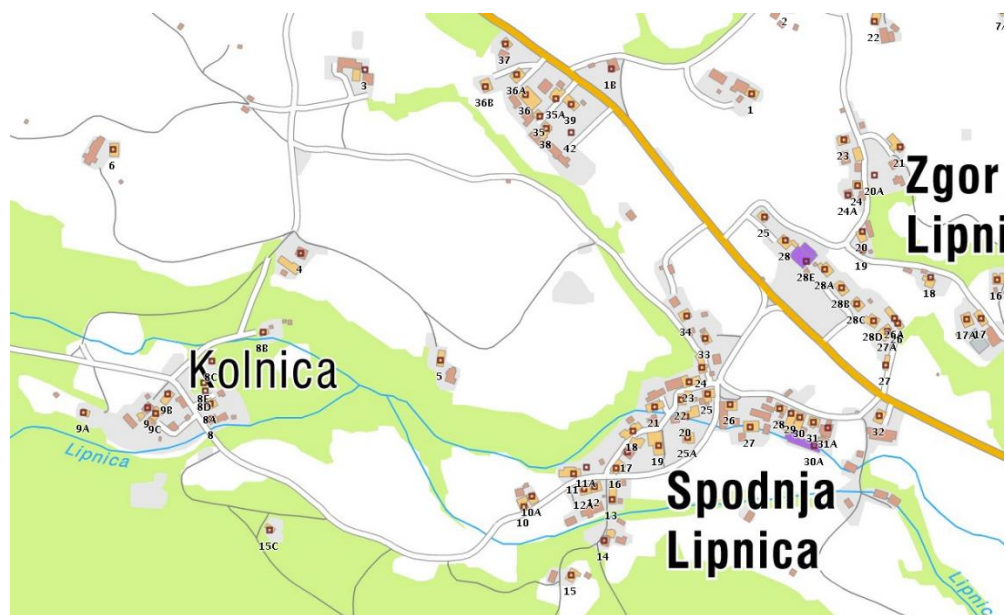
Spodnja Lipnica na topografski karti, 2013