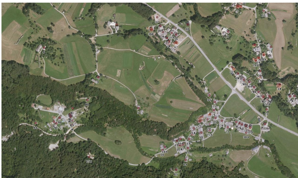
Spodnja Lipnica na orto-foto posnetku, 2013