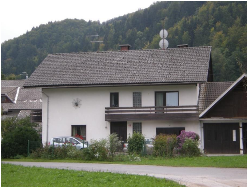
Spodnja Lipnica št. 26